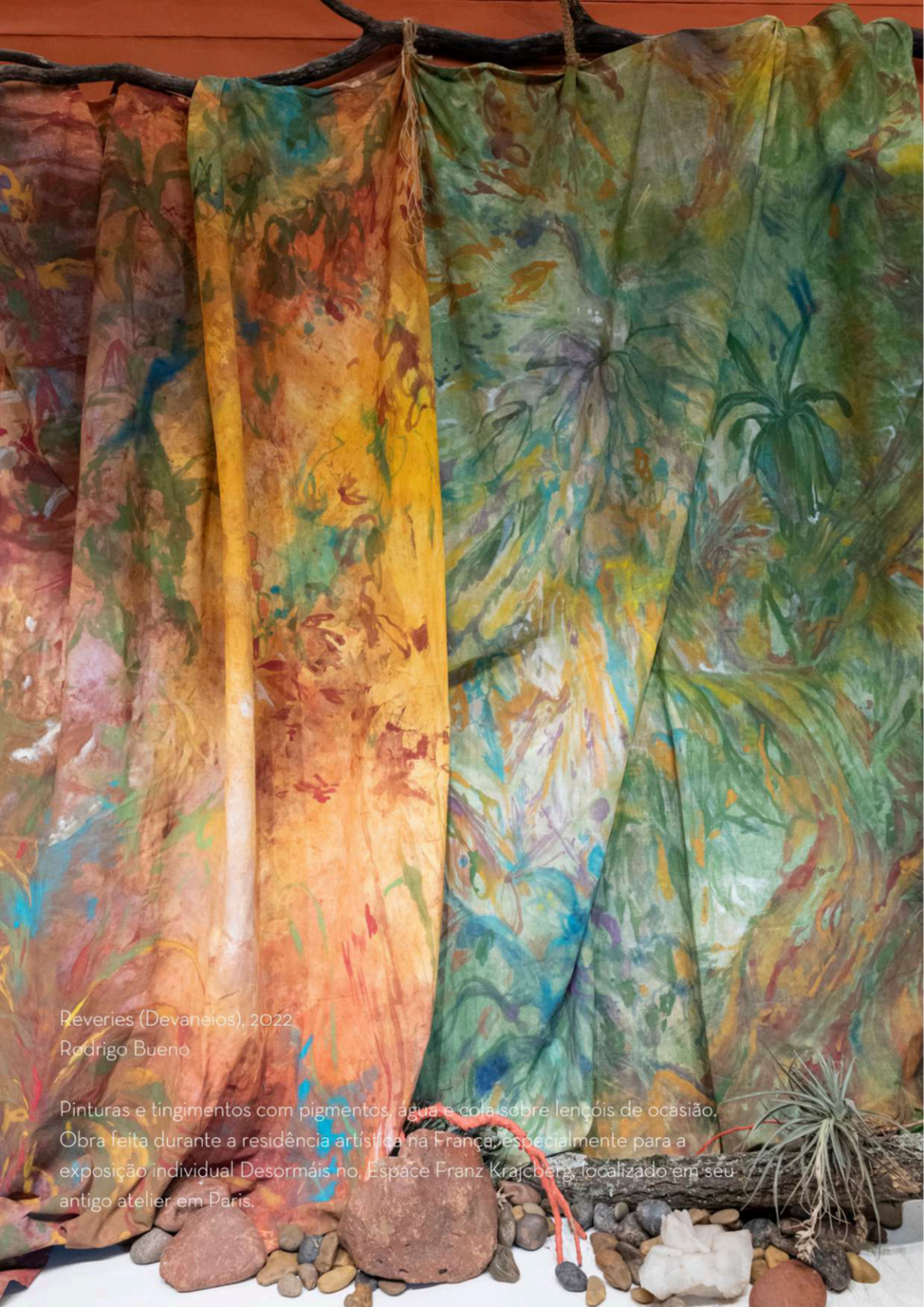
Reveries (Devaneios), 2022 Rodrigo Bueno

Pinturas e tingimentos com pigmentos, água e cola sobre lençóis de ocasião. Obra feita durante a residência artística na França, especialmente para a exposição individual Desormais no Espaço Franz Krajcberg, localizado em seu antigo atelier em Paris.