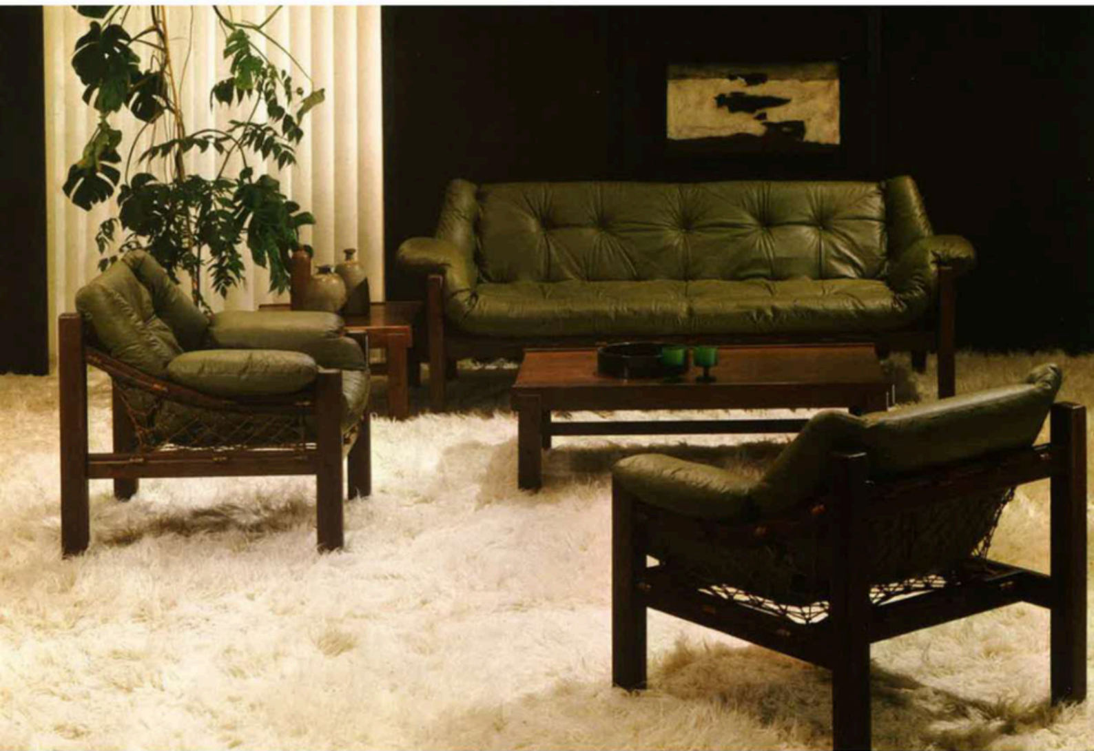
Foto da linha Tijuca para catálogo da Schneider+Fichtel, Acervo Schneider.

ENOCK SACRAMENTO GIANCARLO LATORRACA GRAÇA BUENO [ORG.]