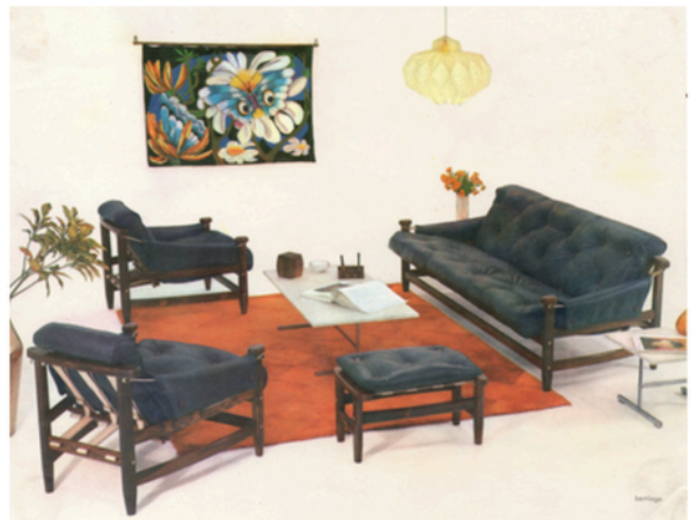
Linha Bertioiga em catálogo da WoodArt, c. 1968.