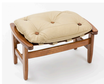
Banqueta: 65 x 43 x 42h cm