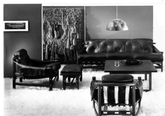
Foto da linha Bertioiga para catálogo da Schneider+Fichtel, c. 1968.