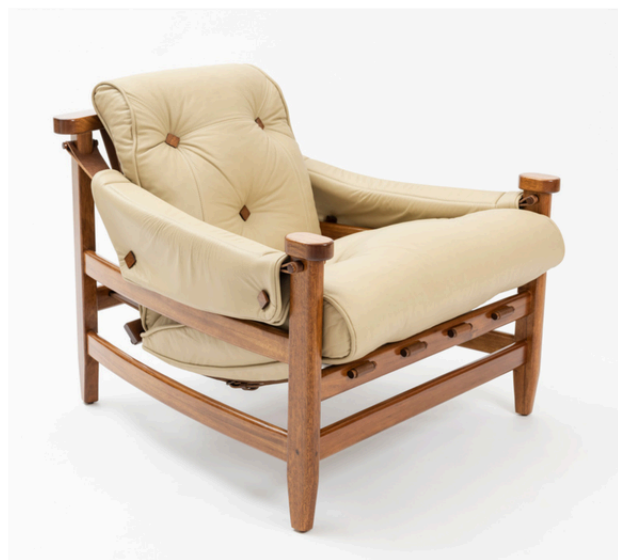
Poltrona: 80 x 84 x 78h cm